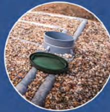
ASSAINISSEMENT NON COLLECTIF